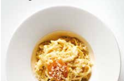
Handgemachte Käsespätzle mit Bergkäse und Schmelzzwiebeln