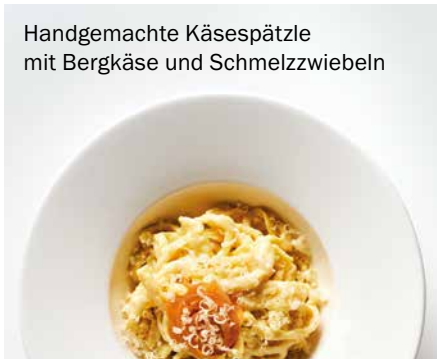
Handgemachte Käsespätzle mit Bergkäse und Schmelzzwiebeln